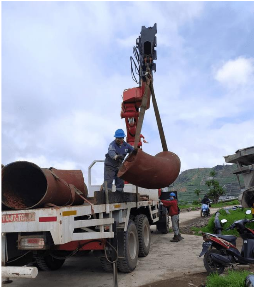
Gambar Ilustrasi Truck Mounted Crane